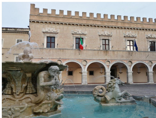
Pesaro - Piazza del Popolo